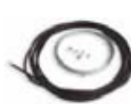
KA1 Kit câble métallique 6 m pour KIO. P.ces/emb. 1