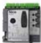
POA1 Logique de recharge, pour PP7024.