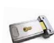
PLA11 Serrure électrique 12 V horizontale (obligatoire pour battant supérieurs à 3 m). P.ces/emb. 1