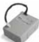
PS124 Batterie 24 V avec chargeur de batterie intégré. P.ces/emb. 1