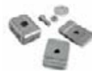
PLA13 Fins de course mécaniques en ouverture et en fermeture. P.ces/emb. 4