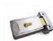
PLA11 Serrure électrique 12 V horizontale (obligatoire pour battant supérieurs à 3 m). P.ces/emb. 1