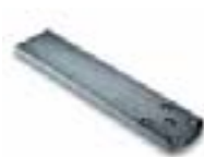
PLA6 Patte de fixation arrière longueur 250 mm. P.ces/emb. 1

Interchangeabilité totale avec la série Moby : même mesures et pattes de fixation