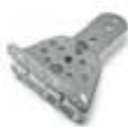
PLA14 Patte de fixation pilier réglable à visser. P.ces/emb. 2